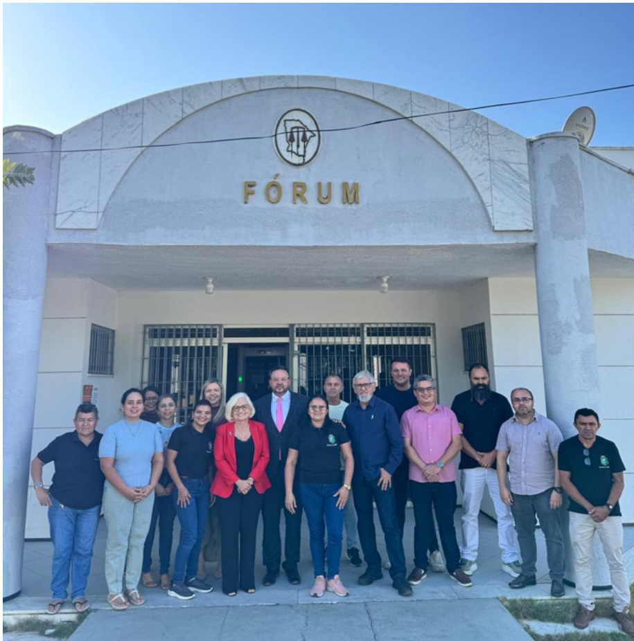
Visita ao Fórum de Caridade em 23/09/2025