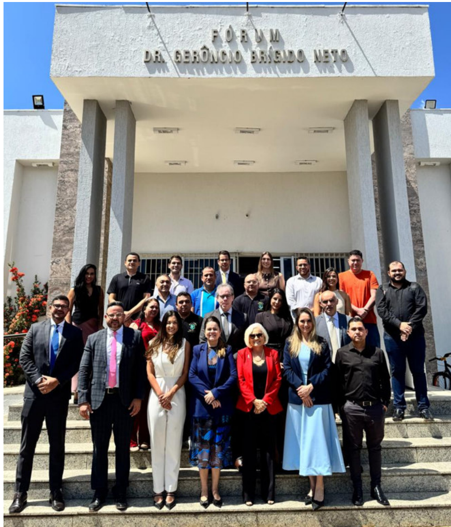
Visita ao Fórum de Canindé em 23/09/2025