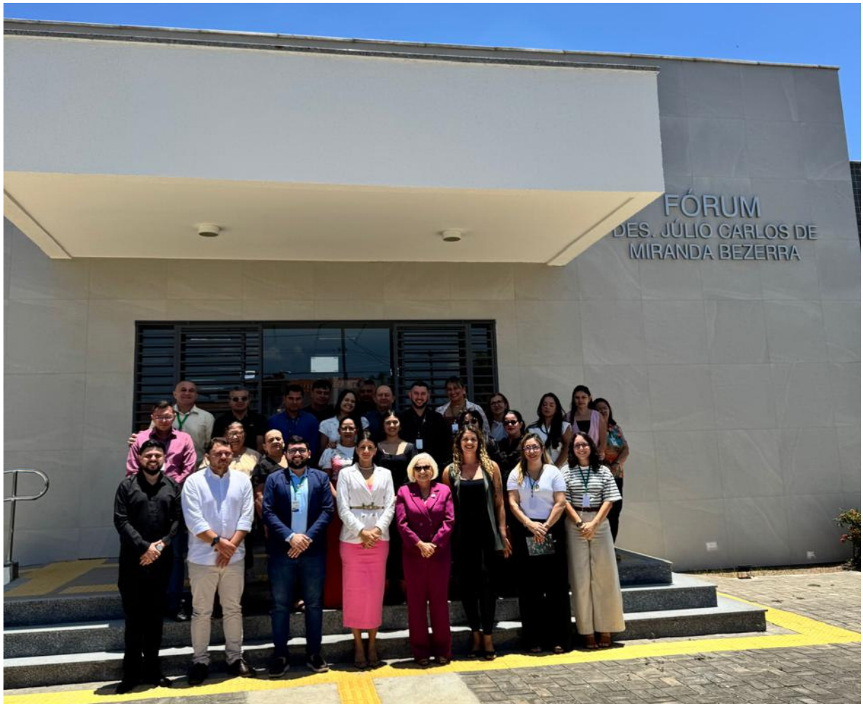
Visita ao Fórum de Boa Viagem em 24/09/2025

Corregedoria-Geral da Justiça do Estado do Ceará Biênio 2025/2027