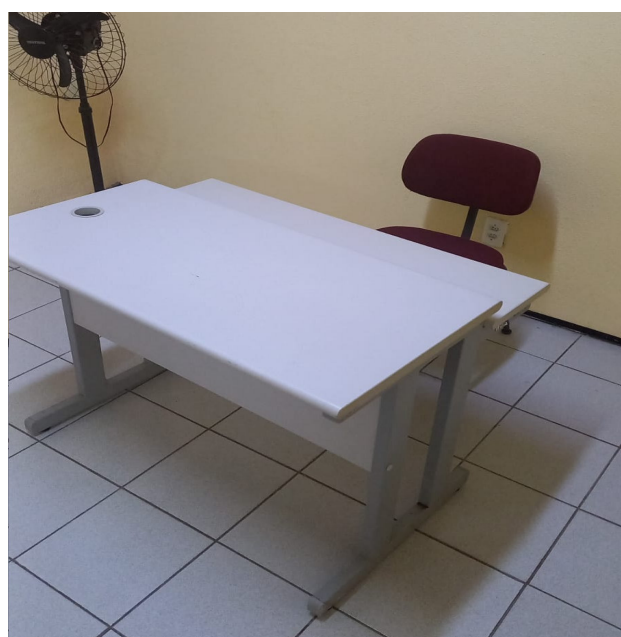
Imagens dos mobiliários novos