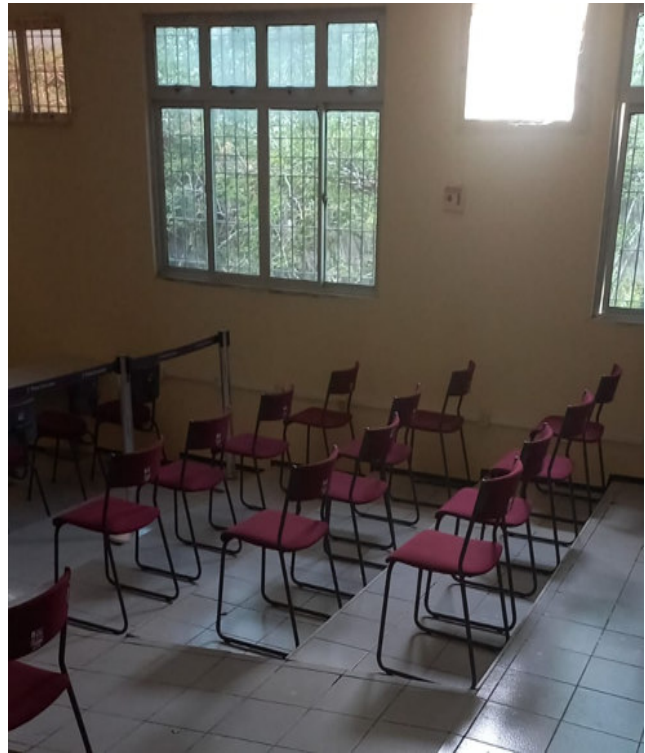
Imagens dos mobiliários antigos (à esquerda) e novos (à direita)