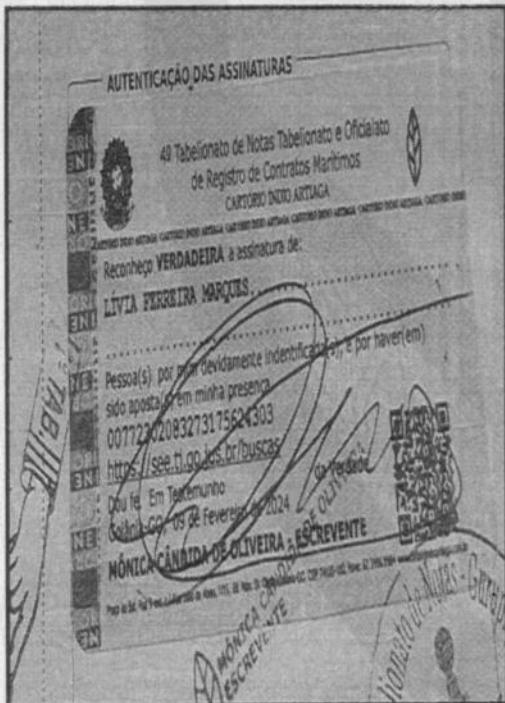
SUSPOSTO RECONHECIMENTO DE FIRMA