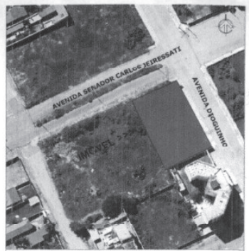
OBS: MAPA DE SITUAÇÃO ACIMA SEM ESCALA