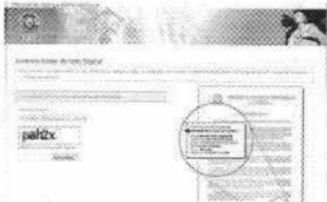
CONSULTA SELO DIGITAL.jpeg 61K