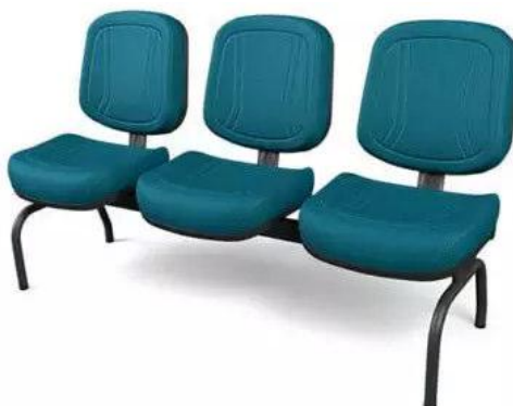
Imagem meramente ilustrativa para referência de design