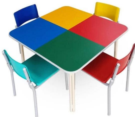
Imagem meramente ilustrativa para referência de design