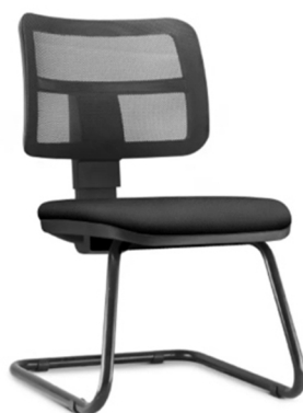
Imagem meramente ilustrativa para referência de design