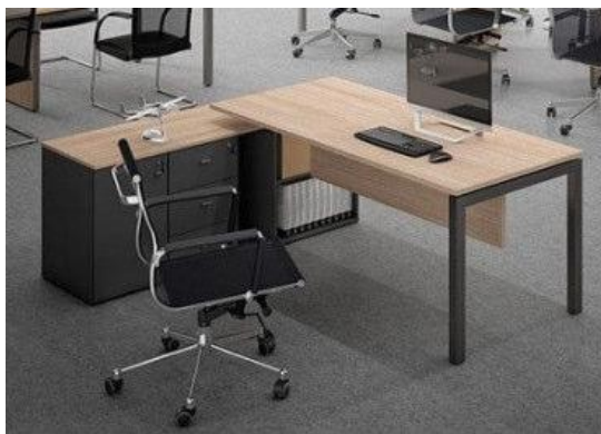
Imagem meramente ilustrativa para referência de design