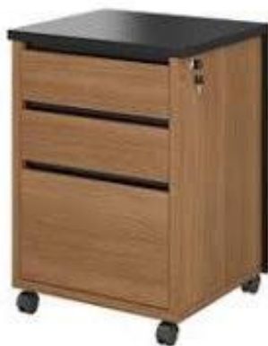
Imagem meramente ilustrativa para referência de design