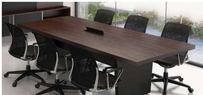
Imagem meramente ilustrativa para referência de design