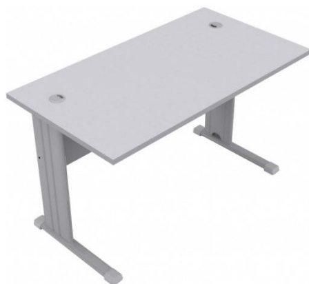
Imagem meramente ilustrativa para referência de design