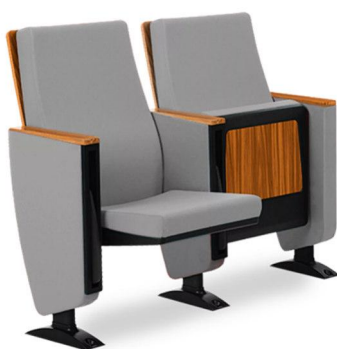
Imagem meramente ilustrativa para referência de design