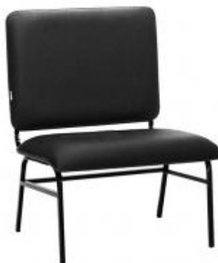
Imagem meramente ilustrativa para referência de design