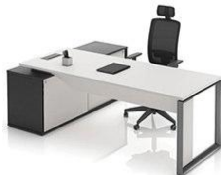
Imagem meramente ilustrativa para referência de design