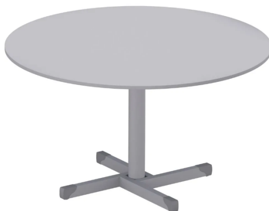
Imagem meramente ilustrativa para referência de design