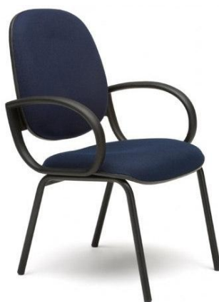
Imagem meramente ilustrativa para referência de design