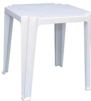
Imagem meramente ilustrativa para referência de design