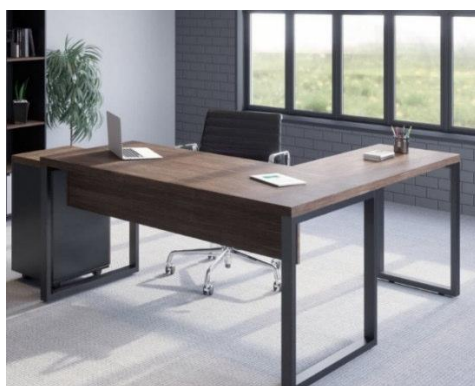
Imagem meramente ilustrativa para referência de design