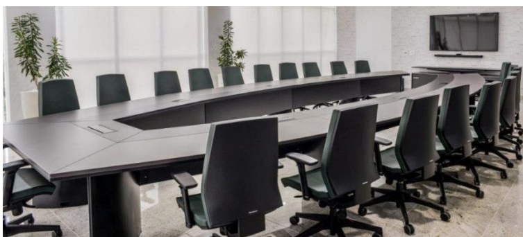
Imagem meramente ilustrativa para referência de design