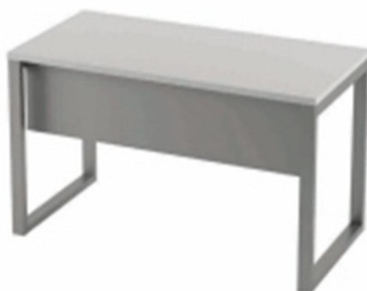
Imagem meramente ilustrativa para referência de design