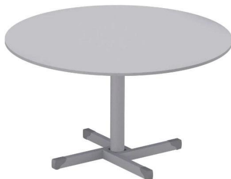
Imagem meramente ilustrativa para referência de design