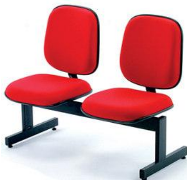
Imagem meramente ilustrativa para referência de design