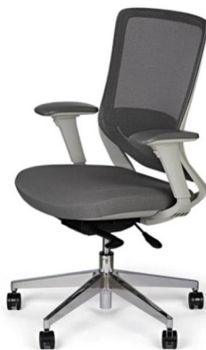
Imagem meramente ilustrativa para referência de design