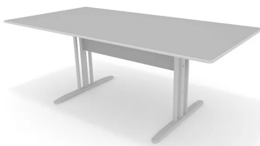
Imagem meramente ilustrativa para referência de design