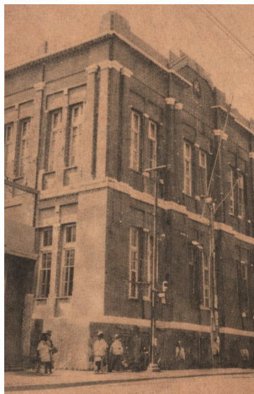
Tribunal de Justiça na década de 1930.