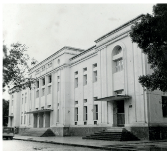
Faculdade de Direito.

Seu interesse pelo Direito adveio ao assistir, ainda aos oito ou nove anos de idade, um júri no município de Granja, em companhia de um tio, onde compreendeu que a figura do juiz era muito importante, pois “ ele era quem botava as coisas no lugar ”. Até aquele momento tinha como sonho a ida para Bahia para fazer medicina.