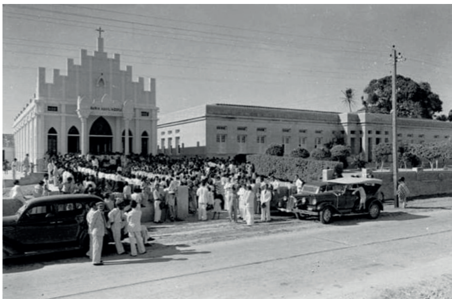
Colégio Juvenal de Carvalho.