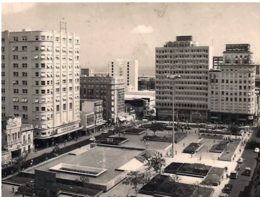
Centro de Fortaleza na década de 1960.

Promovida por merecimento no dia 27.12.1967, para o cargo de juiz de Direito da 9ª Vara Cível, sendo à época, Fortaleza, comarca de 4ª entrância.