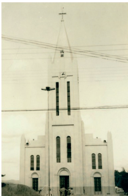
Igreja Matriz.