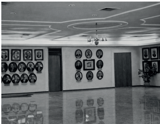
Salão Nobre.

Fez parte do programa de modernização e reaparelhamento do Poder Judiciário o projeto de reforma e ampliação das instalações do Tribunal, sendo uma das prioridades da gestão 1999/2000.