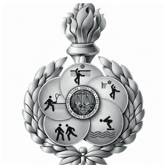
JIJUCE — Jogos Interativos do Judiciário Cearense