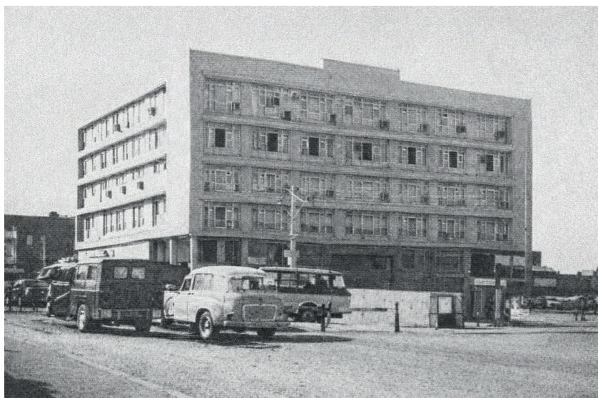
Fórum Clóvis Beviláqua.

Requereu e teve deferida sua remoção para a Comarca de Fortaleza (4 a entrância) no ano de 1962, sendo titular das seguintes unidades judiciárias: 2 a Vara Cível, 10 a Vara Cível, 4 a Vara Criminal - Execuções Criminais e 12 a Vara Cível, permanecendo no 1 o Grau até maio de 1968, quando foi promovida ao cargo de desembargadora.