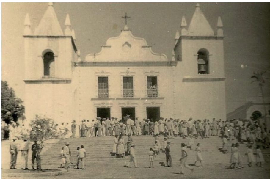
Igreja de Nossa Senhora da Assunção.