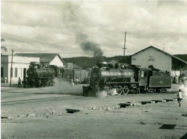
Estação Ferroviária.