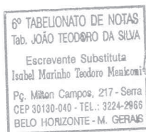
Isabel Marinho Teodoro Meniconi Tabeliã de Notas Substituta