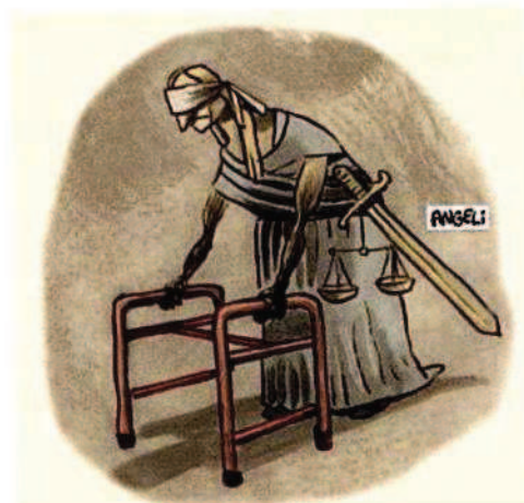
Charge do cartunista Angeli

A duração razoável do processo é garantia constitucional que, além de proteger a dignidade humana, não permitindo que o acusado sofra indeterminadamente restrições de direitos e de liberdade à míngua de uma resposta estatal definitiva, promove a pacificação social, combatendo a impunidade e dando a justa resposta aos atos ilícitos cometidos.